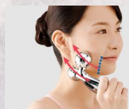
フェイスラインケア